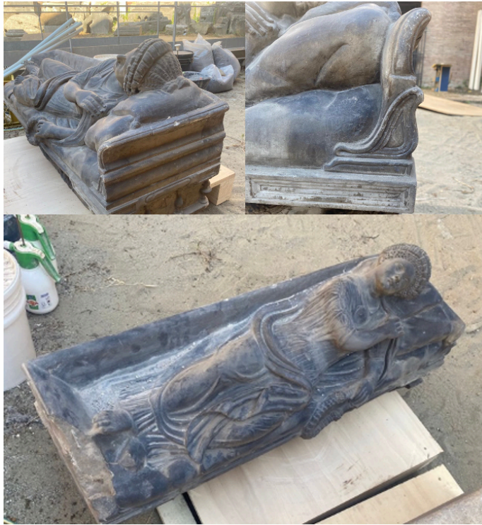
Sarcophagus | Sarcofago Museo Nazionale Romano sponsored by the WE LOVE ITALY EVENT

The annual “ We Love Italy ” fundraising event organised with our international community partners in February 2024 raised €4,500! About 200 guests attended the event at the beautiful Hotel Mediterraneo , our kind hosts. Wine was offered by Castello di Corbara . The funds will restore this unusual marble sarcophagus lid, featuring the relief of a woman conserved in the storerooms of the National Roman Museum.