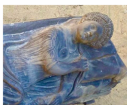
1-5: Arte Fuori Dal Museo; Rotary Roma Campidoglio-PWA- ETRU; Museo Nazionale Romano; IUVART; Sphere-Villa Giulia