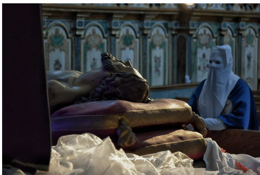
Chiesa di Santa Maria degli Angeli, Gallipoli , Puglia

VENERABILE CONFRATERNITA SANTA MARIA DEGLI ANGELI | GALLIPOLI