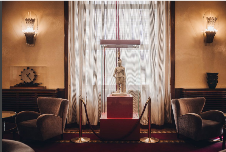
Arte Fuori Dal Museo | Art Out of the Museum Museo Nazionale Romano - Bettoja Hotel Mediterraneo